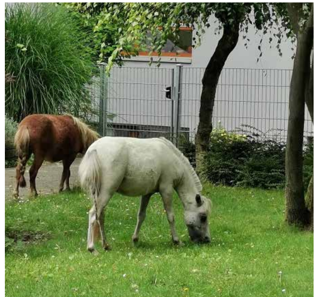
Fühlen sich wohl: die Ponys des Josefshauses