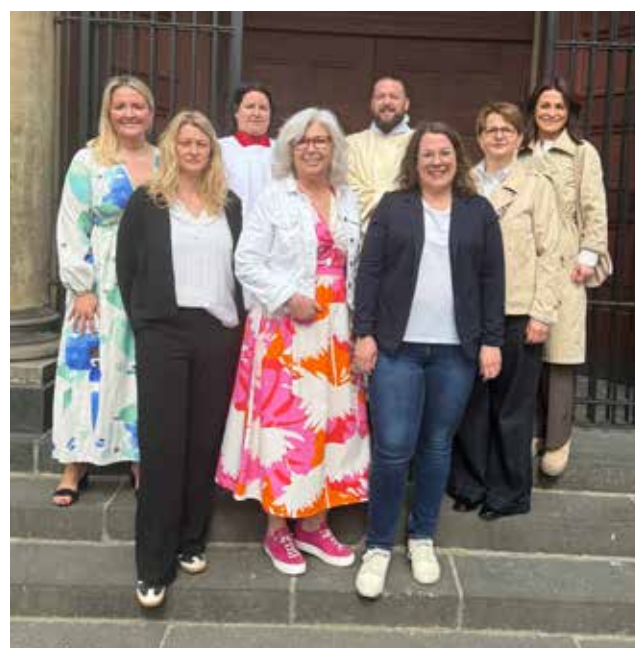
Katecheten der Erstkommunion 2026